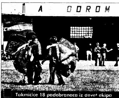
Takmičiće 18 padobranaca iz devet ekipa